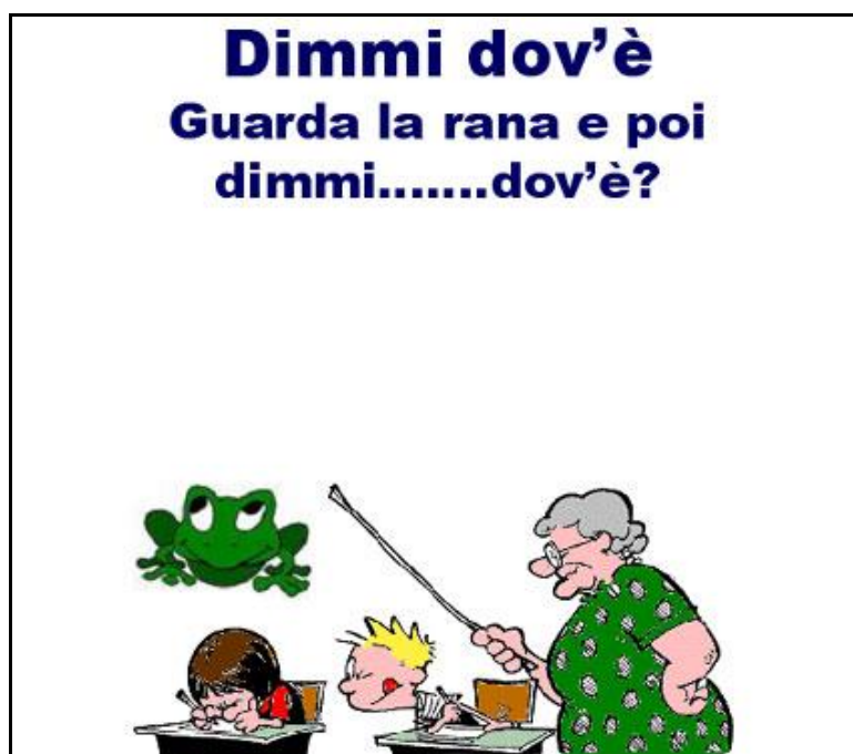
Figura 4 – Scheda con domanda aperta con più possibilità di risposta

La seconda parte della risorsa presenta delle schede più complesse, dove al test a scelta multipla si sostituisce una domanda aperta. Qui le risposte corrette possibili sono più di una. Si può chiedere ad ogni gruppo di formulare più risposte possibili, assegnando un punto per ogni frase prodotta correttamente.