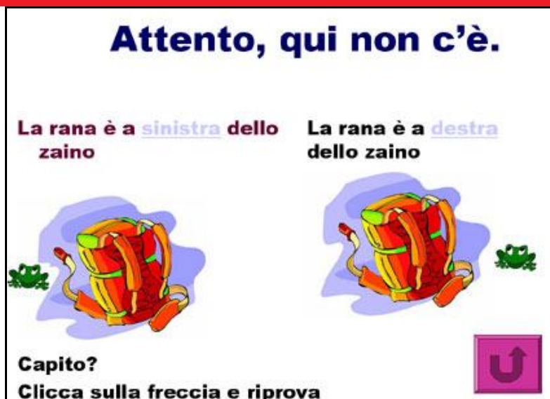
Figura 3 – Pagina di rinforzo, che si apre in caso di errore nella risposta

La seconda parte della risorsa presenta delle schede più complesse, dove al test a scelta multipla si sostituisce una domanda aperta. Qui le risposte corrette possibili sono più di una. Si può chiedere ad ogni gruppo di formulare più risposte possibili, assegnando un punto per ogni frase prodotta correttamente.