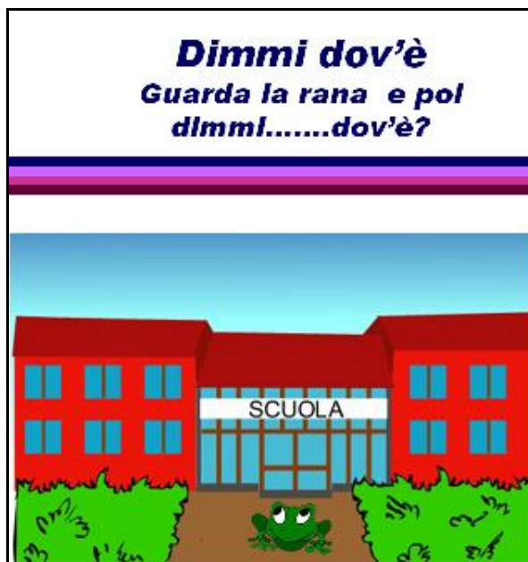
Figura 5 – Scheda con domanda aperta con più possibilità di risposta

facilmente essere ampliata, a discrezione dell'insegnante, per arricchire il lessico specifico di un ambiente o un contesto specifico. Ad esempio, volendo arricchire il lessico relativo alle stanze della casa si potranno scegliere tutte immagini relative a quell'ambiente e così via.