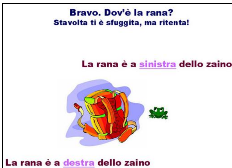
Figura 2 – Scelta dell'indicatore spaziale relativo all'immagine

Gli alunni vengono successivamente divisi in squadre e si spiega qual è lo scopo del gioco e quale ruolo avrà ognuno nel gruppo. Ogni squadra dovrà guardare le diapositive proiettate sulla lavagna, capire dove si trova la rana ed esprimere correttamente la frase, in forma orale o scritta, in un tempo stabilito.